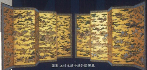
国宝 上杉本活中港外回屏風

大人料金 最大 500円もお得!! 販売価格 ※子ども料金は小・中学生まで 4枚綴 (4施設分) 一律 2,000円 税込 6枚綴 (6施設分) 大人 2,700円 税込 子ども 1,000円 税込